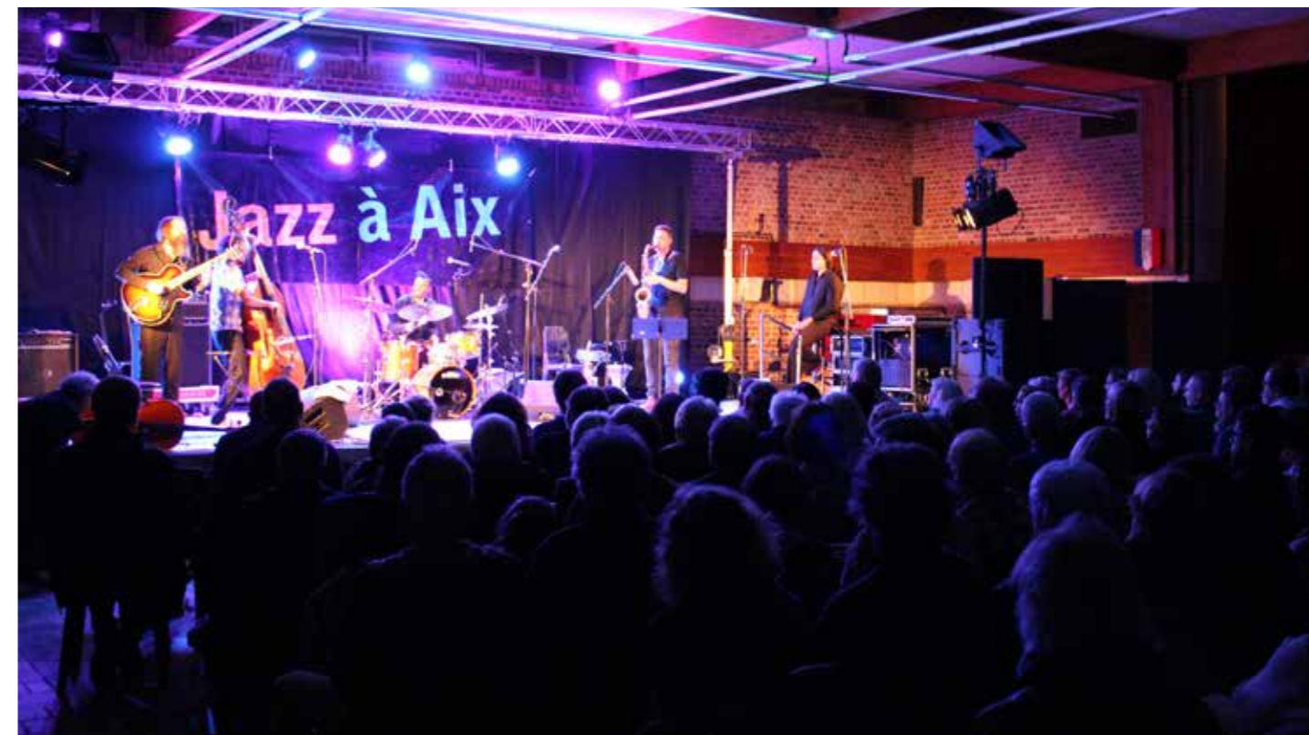
JAZZ À AIX (FESTIVAL TOUT EN HAUT DU JAZZ)