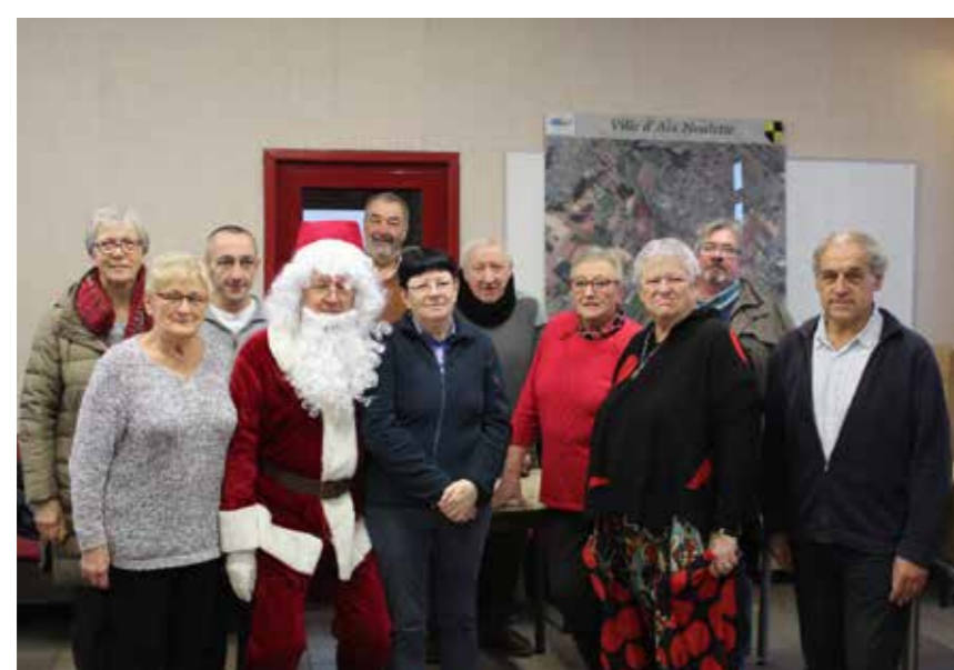
LES LUTINS BÉNÉVOLES ASSOCIATIFS ET ÉLUS DU PÈRE NOËL